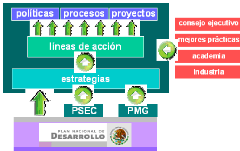
Figura 7.1 Estrategia de Gobierno Digital

El elemento identificado como estrategia de Gobierno Digital Federal presentado en el primer nivel del modelo de Gobierno Digital, se puede desagregar a su vez en (1) estrategias, (2) líneas de acción, y (3) políticas, procesos y proyectos, tal como se presenta en la figura 7.1