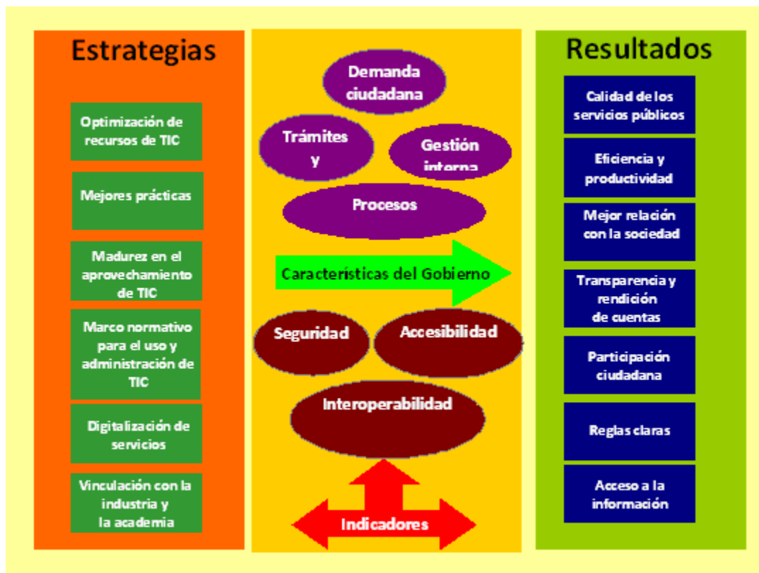
Figura 8.1 Modelo de Evaluación de Gobierno Digital *

* Basado en el Modelo multi-dimensional de medición de gobierno electrónico para América Latina y el Caribe, Mayo 2007, Naciones Unidas, CEPAL y otros, por José Ramón Gil-García, Luis Felipe Luna Reyes y Hernán Moreno Escobar. http://www.cepal.org/Socinfo